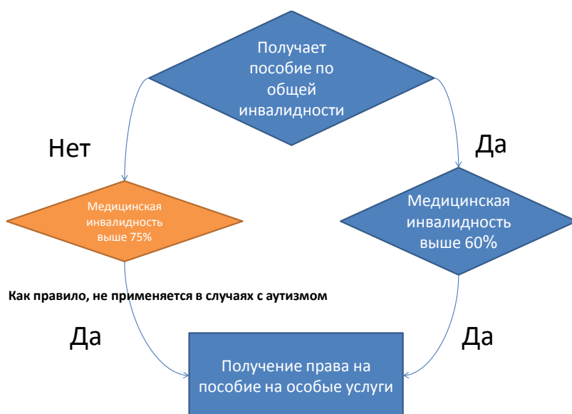
Схема В: порядок определения права на пособие на особые услуги

Пособие на особые услуги выплачивается инвалиду, который нуждается в существенной помощи другого человека при выполнении повседневных действий (одевание, прием пищи, купание, передвижение по дому и контроль стула и мочеиспускания), или нуждается в постоянном присмотре во избежание угрозы для его жизни и жизни окружающих.