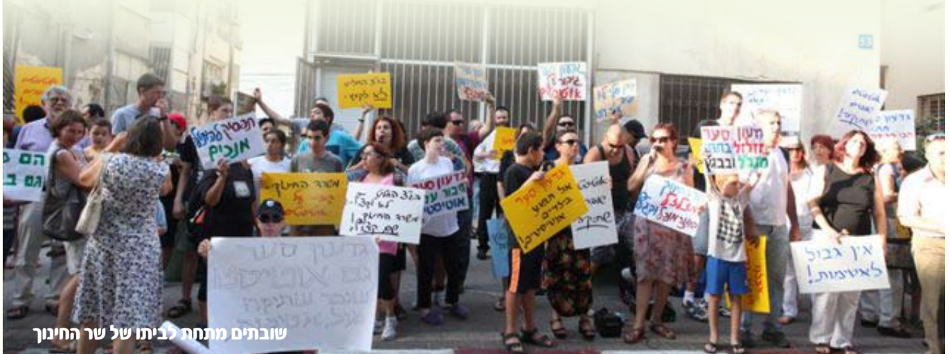
שובתים מתחת לביתו של שר החינוך